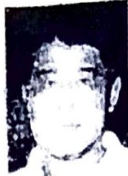
KOTA SEMARANG 13.11.2012